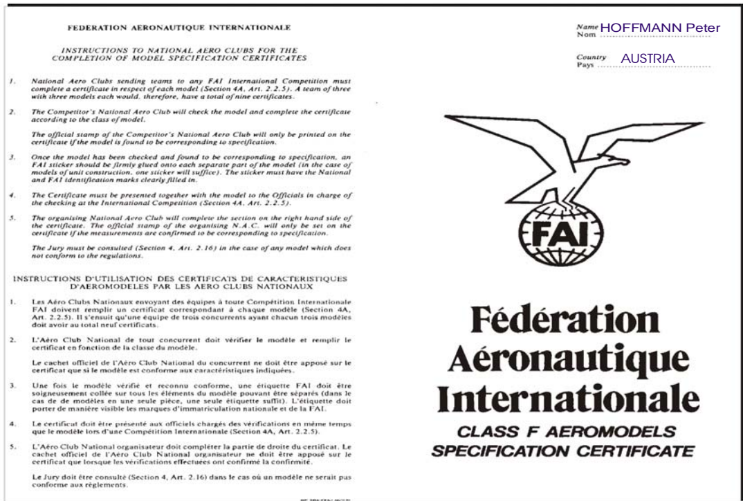
Abbildung -2 Model Specification Certificate Vorderseite

Teilnehmer von WM + EM müssen noch das entsprechende "Model Specification Certificate" der FAI ausgefüllt zur Bauprüfung vorlegen. Dieses ist vom Mannschaftsführer vorher zu kontrollieren!