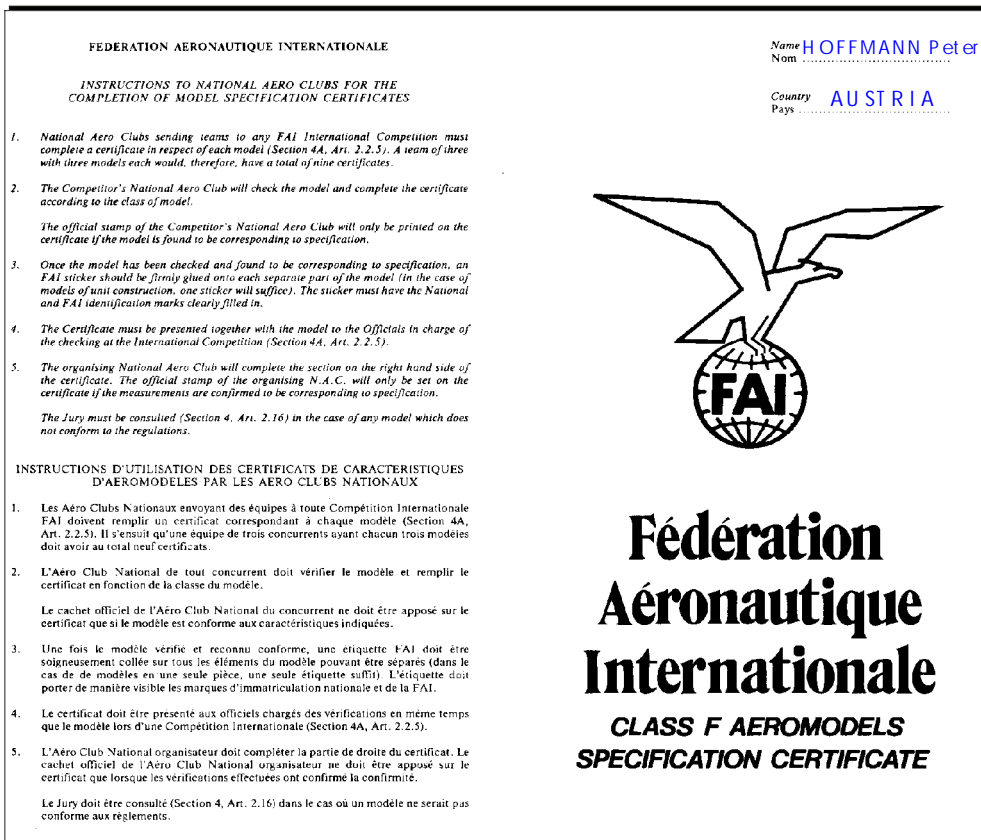
Abbildung 2: Model Specification Certificate - Rückseite